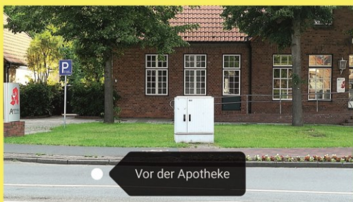
Vor der Apotheke