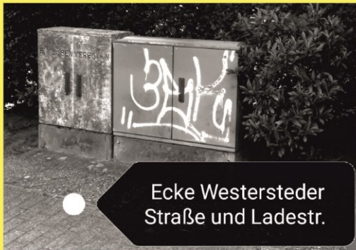
Ecke Westersteder Straße und Ladestr.