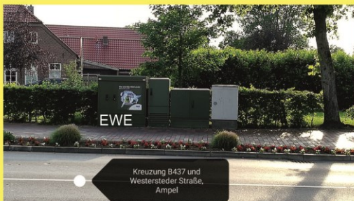
Kreuzung B437 und Westersteder Straße, Ampel